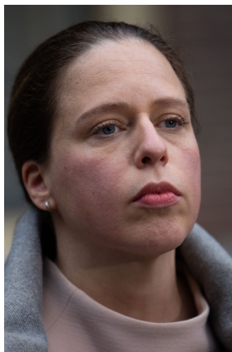
Carola Schouten.