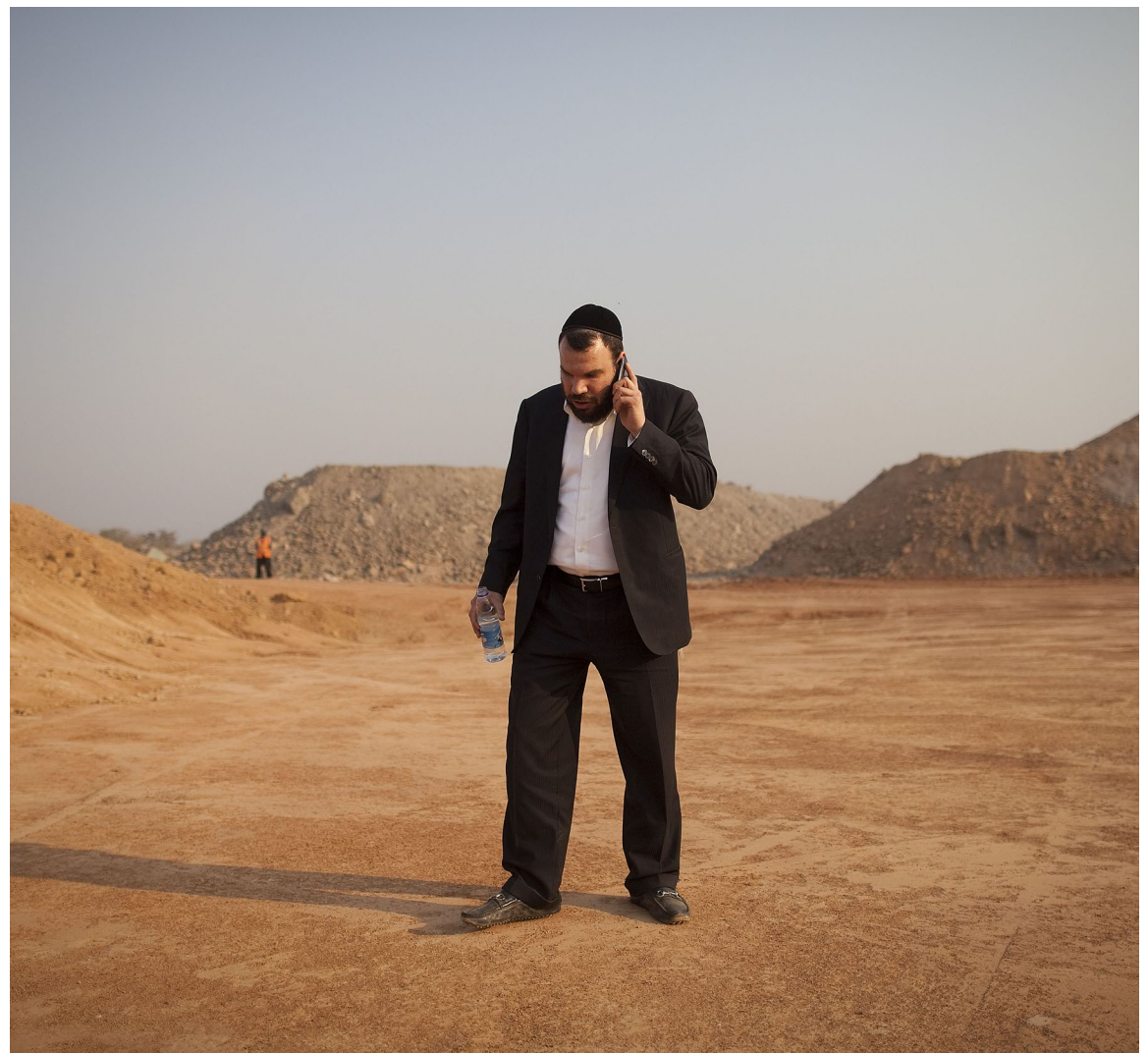
Dat de VS Gertler opnieuw aan de financiële ketting leggen, is ook een opdoffer voor Kabila.